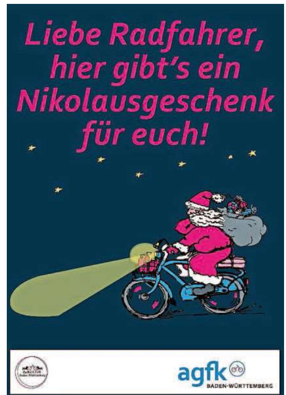
der Nikolaus und ein vorbildlicher Radfahrer bei der agfk-BW-Aktion 2019

Die Arbeitsgemeinschaft Fahrrad- und Fußgängerfreundlicher Kommunen in Baden-Württemberg e. V. (AGFK-BW) ist ein Netzwerk von zurzeit 78 Städten, Landkreisen und Gemeinden. Unterstützt und gefördert vom Land, wollen die Kommunen das Radfahren als selbstverständliche, umweltfreundliche und günstige Art der Fortbewegung fördern, mehr Menschen sicher aufs Rad bringen und ihnen die Freude am Radfahren vermitteln – für eine neue Radkultur in Baden-Württemberg. Ein besonders wichtiges Anliegen ist die Erhöhung der Verkehrssicherheit von Radfahrerinnen und Radfahrern.